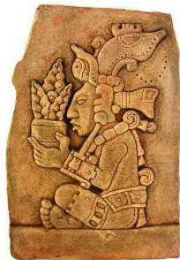
Yum Kaax - die Mais Göttin der Maya.

Während der Kolonisierung Lateinamerikas wurde der Bevölkerung der Maya-Kulturen im Südwesten Mexikos eine heteronormative Geschlechterkonstruktion aufgezwungen, die versuchte, jegliche Sexualität außerhalb dieser Konstruktion zu unterdrücken. Mit Dr. Rúb(en) Solís sprechen wir über Erfahrungen nicht-binärer Seinsweisen in den heutigen Maya-Kulturen und laden zum Gespräch ein.